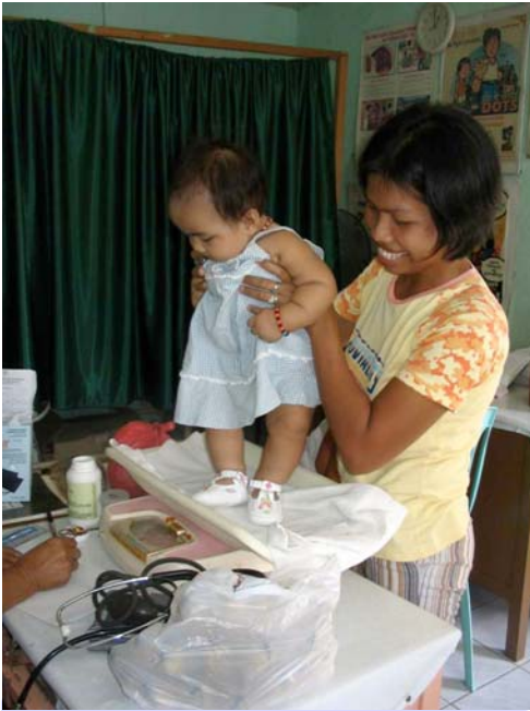
Lapsen punnitsemista terveysasemalla