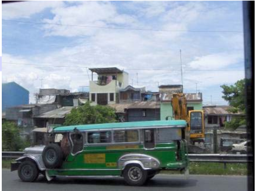
Katukuvaa matkalla Manilasta Silangiin